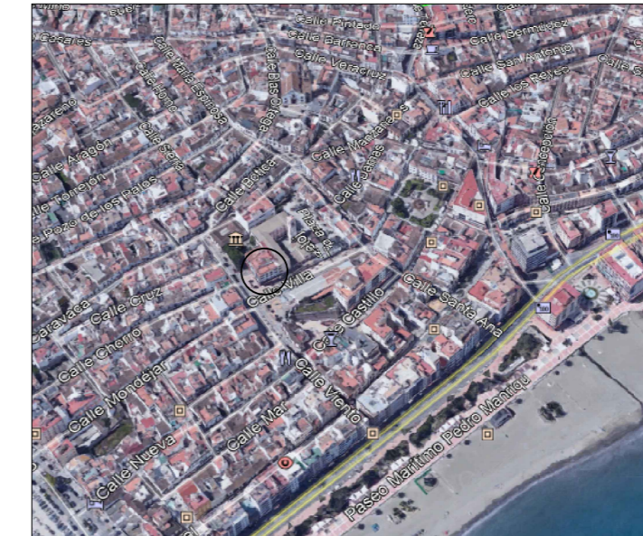
SITUACIÓN Y EMPLAZAMIENTO

Sup. Útil total: 97,39m 2 Sup. construida total: 110,20m 2