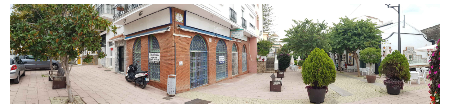
VISTA DESDE PLAZA AUGUSTO SUÁREZ DE FIGUEROA